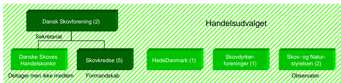
Figur 1: Overblik over Handelsudvalget

30. Dansk Skovforening er skovbrugets brancheforening. Dansk Skovforening havde i 2007 omkring 500 medlemmer, hvis samlede skovareal dækker omkring 150.000 hektar. Medlemmerne af Dansk Skovforening er typisk større skovejere og virksomheder, der handler med træ. En del mindre skovejere er imidlertid indirekte medlemmer af Dansk Skovforening i kraft af deres medlemskab af Skovdyrkerforeningerne, jf. nedenfor i punkt 43-46.