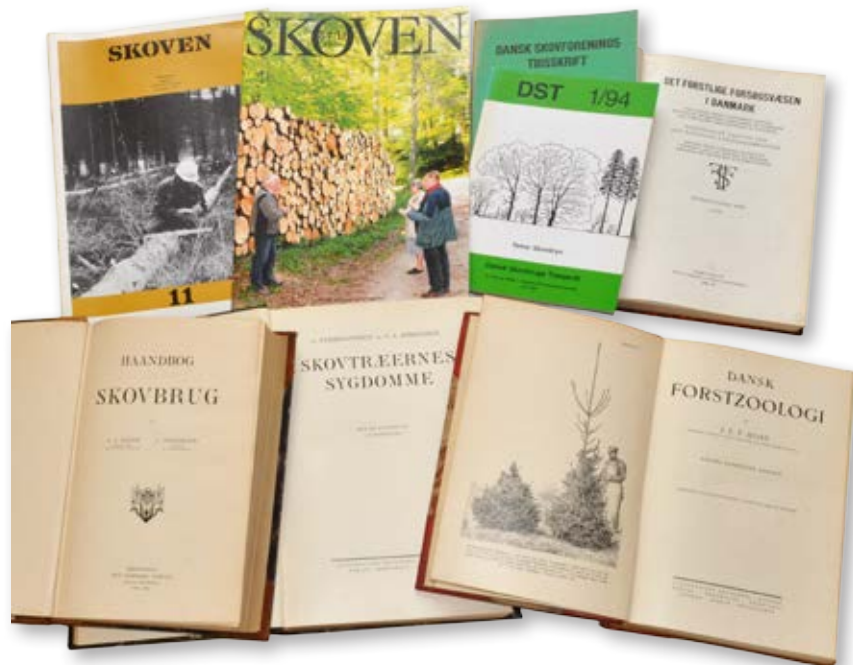
Digitalisering af gamle bøger og tidsskrifter bevarer vigtig viden for eftertiden.

Træplantningen blev i 2016 gennemført i den første uge af november, og dette er også planen for 2017. De deltagende klasser får tilsendt gratis træer, som de kan plante enten på skolen eller i en nærliggende skov. Ud over ugen, hvor der plantes, har skolerne mulighed for at anvende undervisningsmateriale fra Skoven i Skolen både op til, under og efter selve træplantningen. Der er udviklet et særligt hæfte "Genplant Planeten – Træets kredsløb og klimaet", som sendes til alle deltagende klasser.