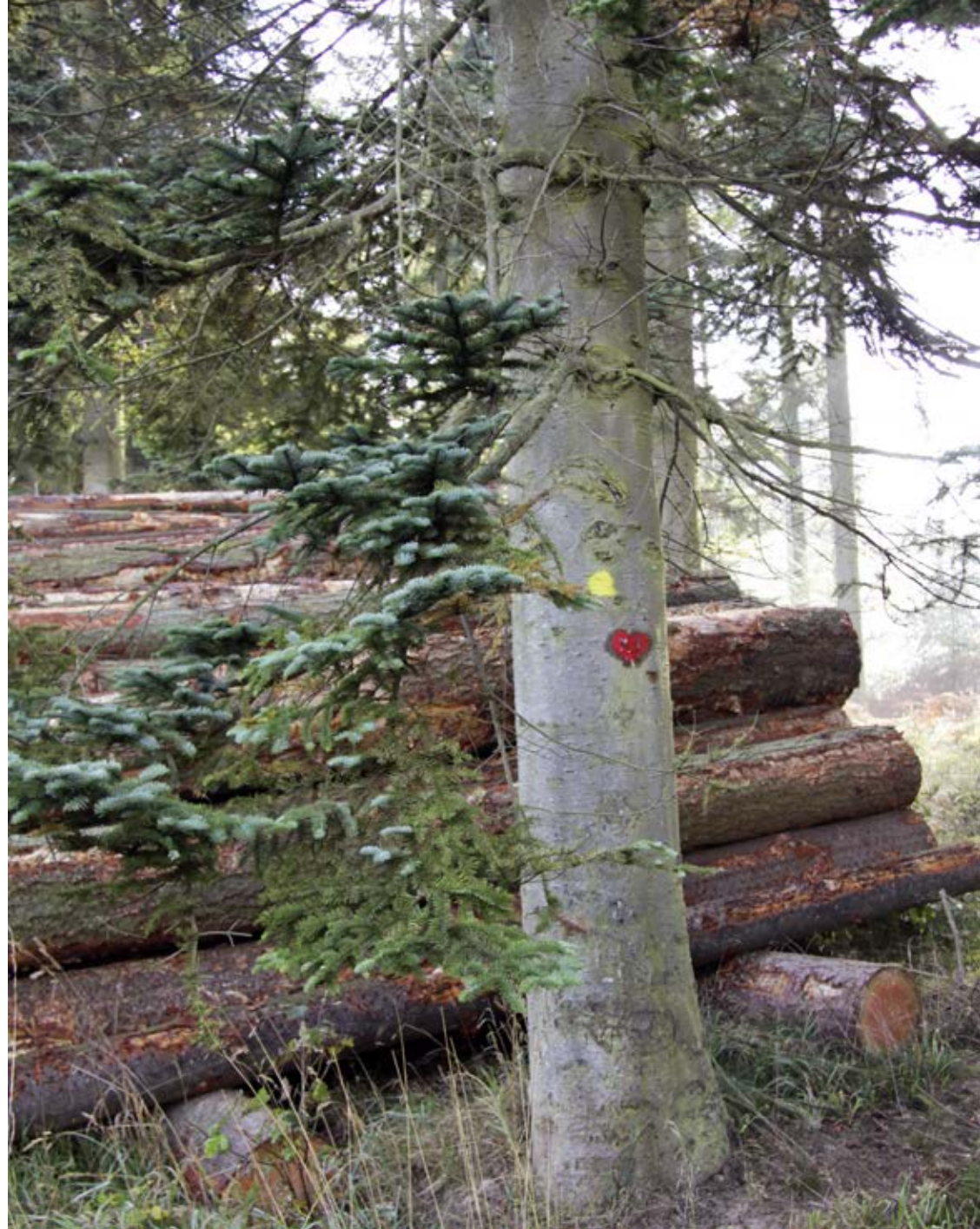
En skovkontoordning vil give ejerne tryghed og fleksibilitet.

Så en skovkontoordning vil kunne gøre en reel forskel for ejerne og dæmme op for de store og ikke kontrollerbare udsving i indtjeningen. Derfor arbejder vi fortsat på at få indført en sådan ordning.