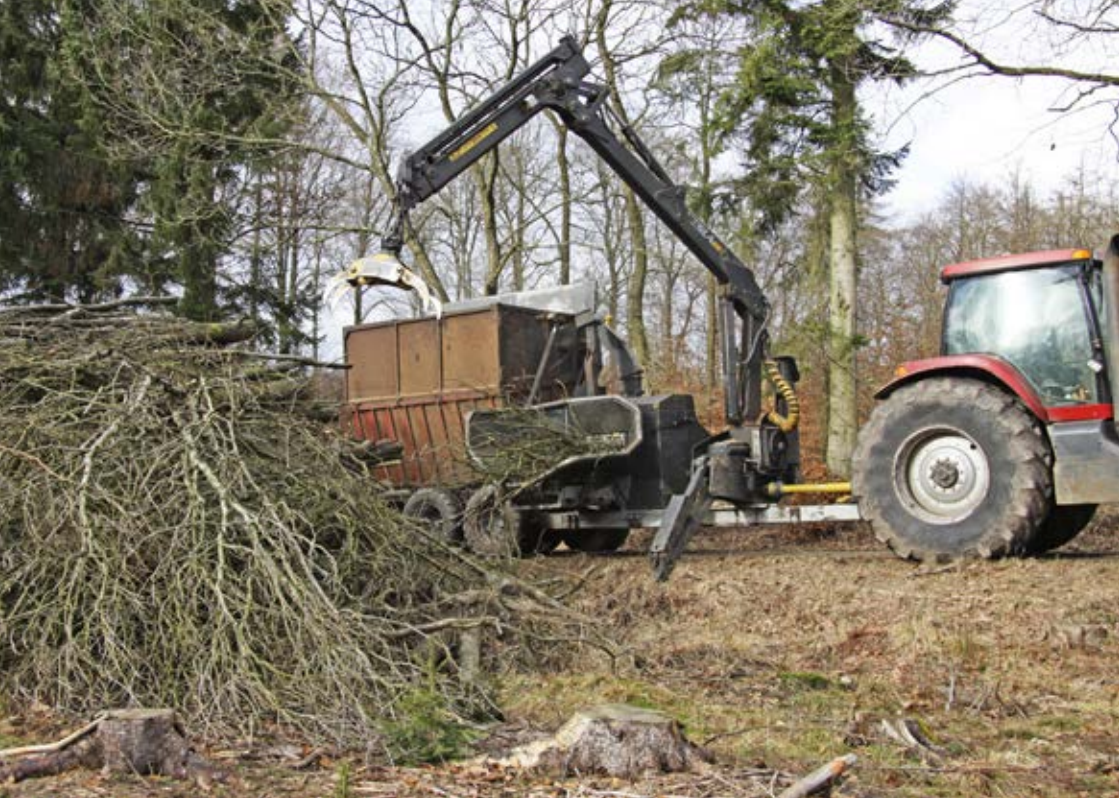
Begrænsning af lokal biomasse til fordel for varmepumper gavner ikke den grønne omstilling.