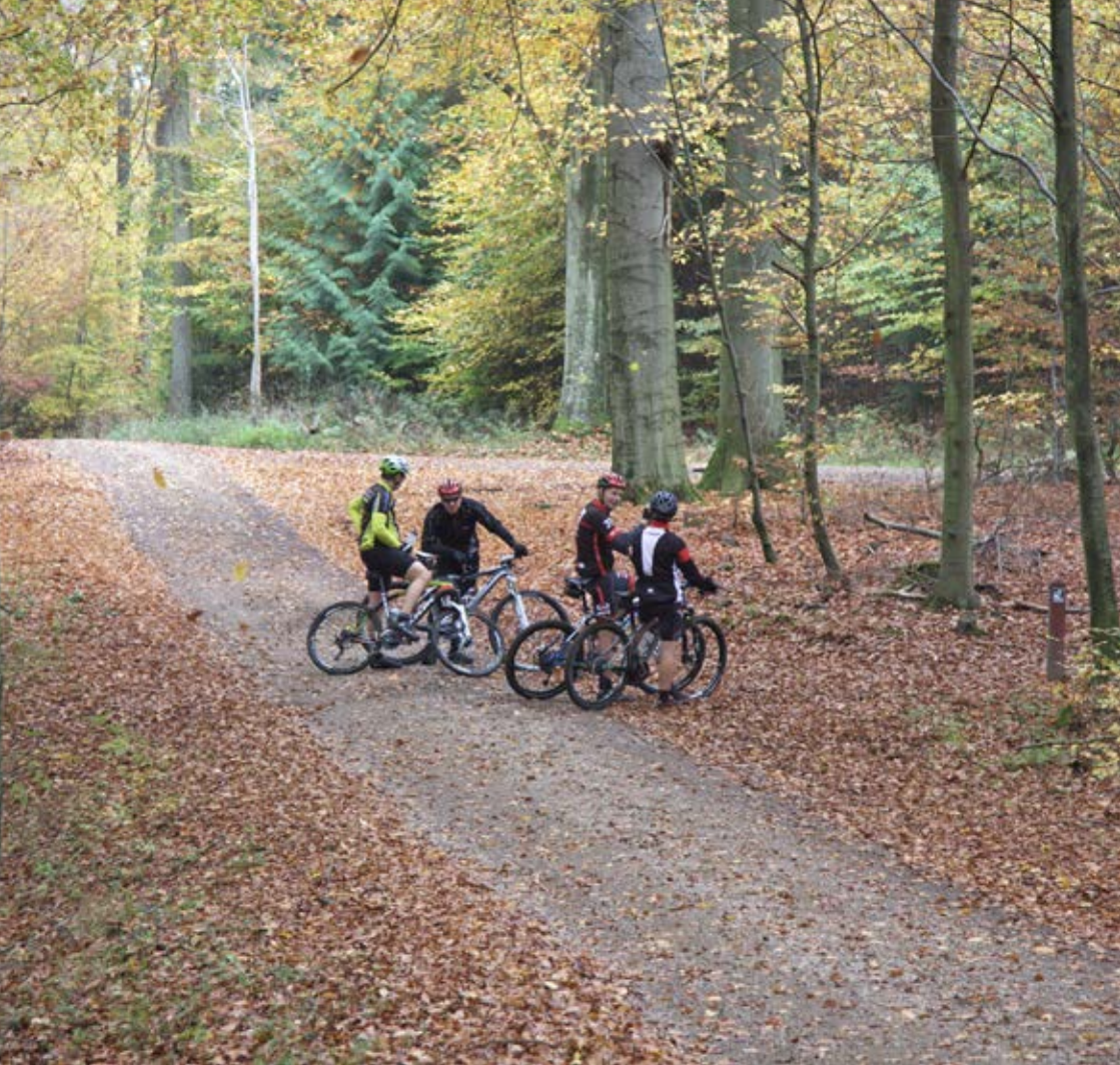
Mountainbike kørsel i skovene giver stadig større udfordringer. Men der er måske en løsning på vej.