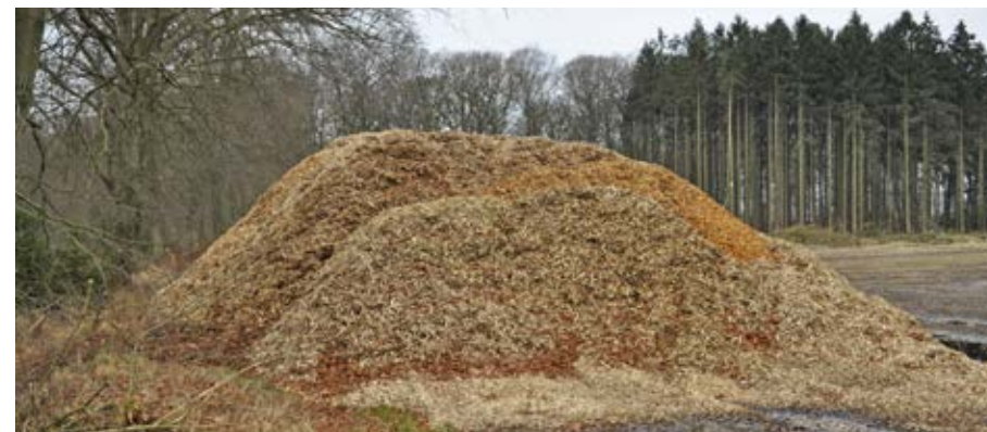
Træflis til energi er den hurtigste og mest effektive måde at nedbringe CO 2 -udledningen på.

Energikommissionen kom i april med deres anbefalinger til en omkostnings-effektiv omstilling. Anbefalinger som ventes at være afsæt for efterårets forhandlinger om et energiforlig for perioden 2021-2030.